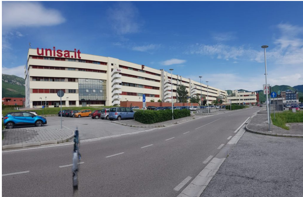
Figura 2: Svoltare a sinistra: Il Campus (Punto 4 della mappa)