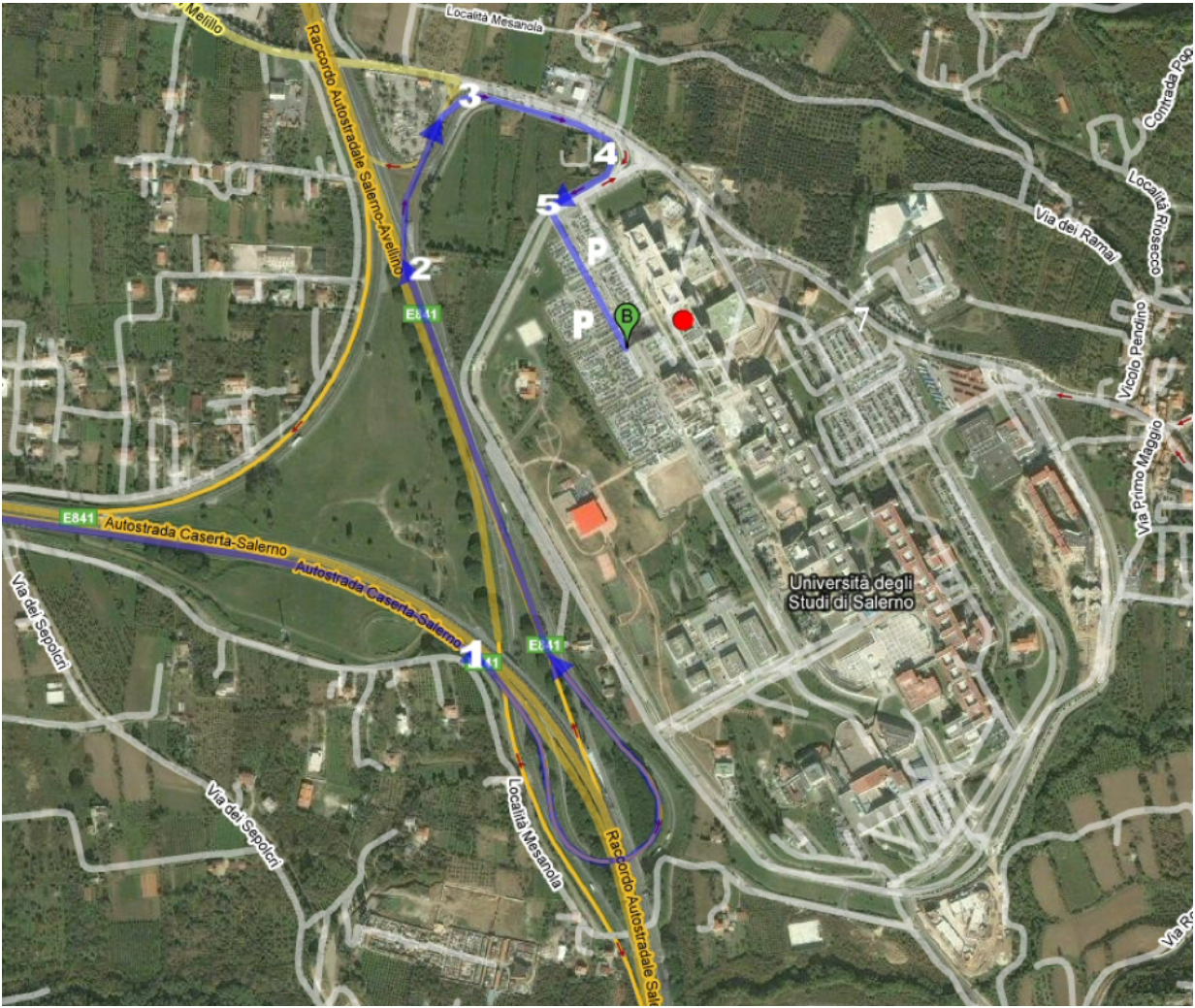
Figura 1: Mappa del Campus di Fisciano (Punti di interesse)