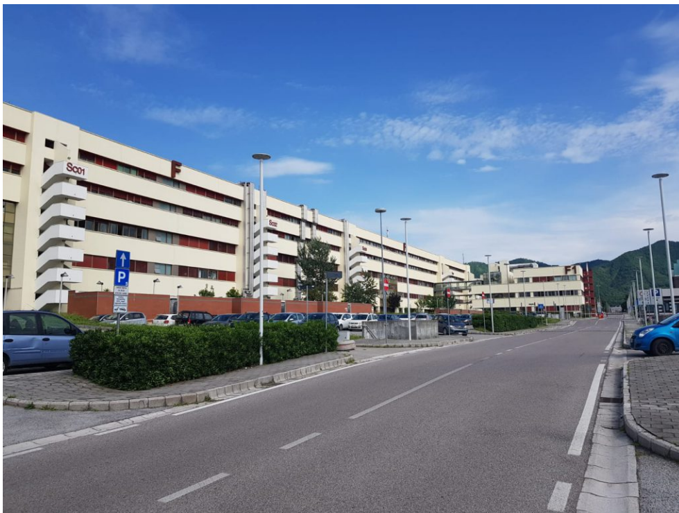
Figura 3: Parcheggi a destra e sinistra (Punto 5 della mappa)