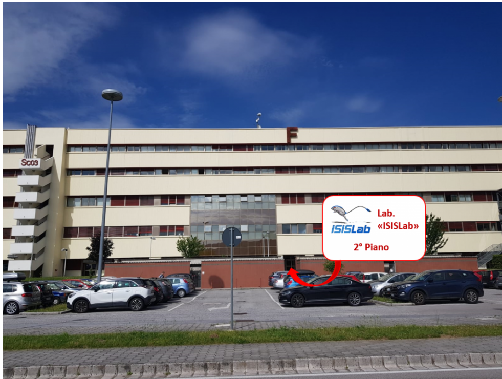
Figura 4: Ingresso per ISISLab (Punto rosso della mappa)