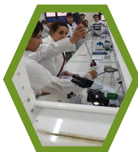
Indirizzo Chimico e biotecnologie