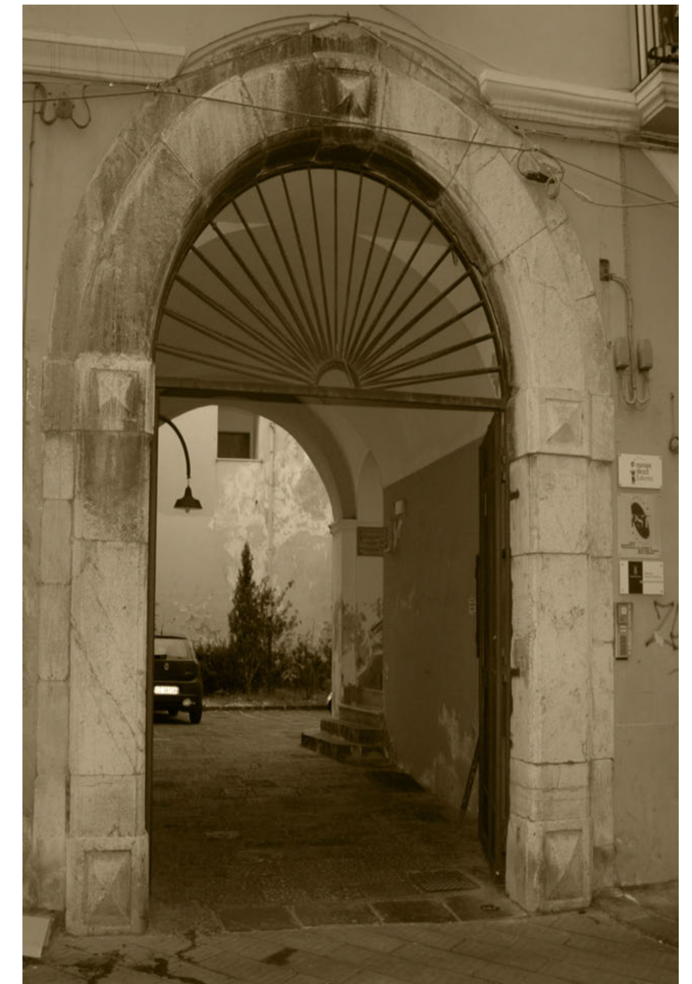
Ingresso Palazzo Pedace