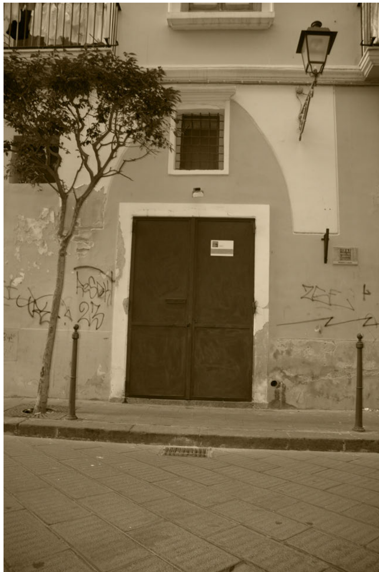
Ingresso Sede FAI Antica Santa Maria de Cancellariis